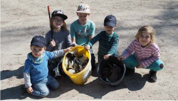
Reinigung des Willi Näpfel Weges am Nagelberg