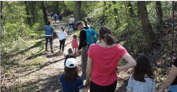
dem Osterhasen auf der Spur ...