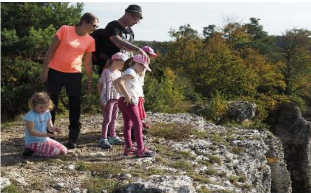
Wanderung rund um Solnhofen